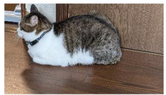
外が気になるわ (ミカン)